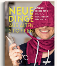
NEUE DINGE AUS ALTEN STOFFEN. GENIALE IDEEN ZUM NÄHEN, REPARIEREN, UPCYCLN smarticular 2023, 204 Seiten, 22,95 Euro